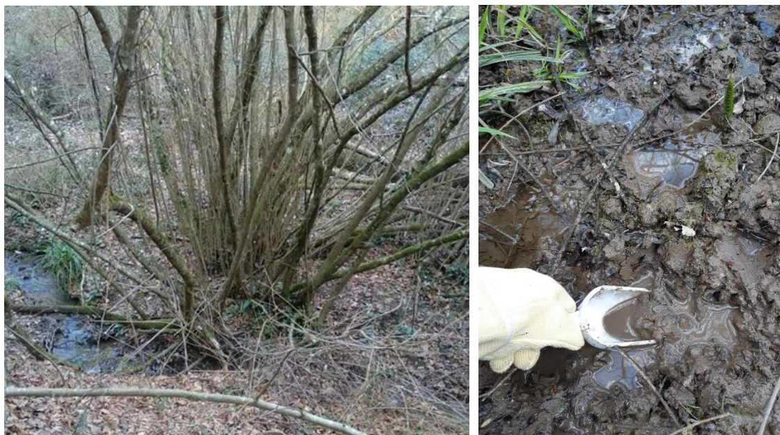
Figura 1. Campionamento di fanghi.

Si riportano sotto i risultati della TGA (Tab. 2), da cui si evince una grande presenza di materiale organico sotto forma di volatili secche (circa il 20%). La stessa presenza di materiale organico si evince per l'elevata percentuale di ceneri (24%).