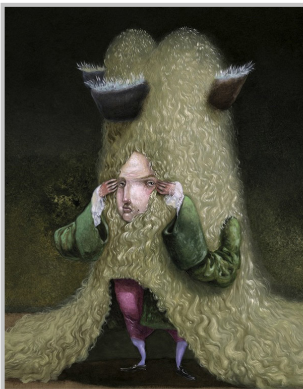
Cosimo, logosedizioni, 2016

Infatti, molta di questa sua orrenda cucina era studiata solo per la figura, più che per il piacere di farci gustare insieme a lei cibi dai sapori raccapriccianti. Erano, questi piatti di Battista, delle opere di finissima orafria animale o vegetale: teste di cavolfiore con orecchie di lepre poste su un colletto di pelo di lepre; o una testa di porco dalla cui bocca usciva, come cacciasse fuori la lingua, un'aragosta rossa, e