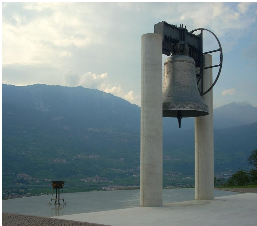
Il suono ‘imposto’: campana dei Caduti, Rovereto.

Renzo Piano sostenne che “ l’architettura è un’arte imposta ” che ci troviamo di fronte, tuttavia occorre precisare che, mentre possiamo ancora evitare lo sguardo di fronte a quel brutto condominio, non possiamo non sentire i 12 rintocchi delle campane di mezzogiorno a meno che non ci tappiamo forzatamente le orecchie.