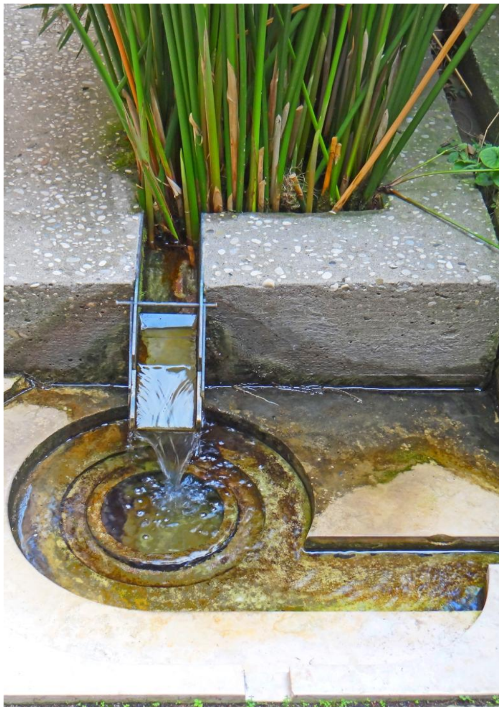
Figura 1 – Suoni d’acqua. Carlo Scarpa – Fondazione Querini Stampalia, Venezia.

vincere che la città continua la sua vita felice... questa è la musica che senti” (Calvino, 1995: 66-71).