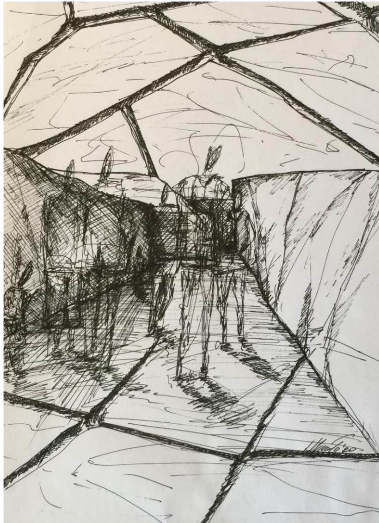
"Sui passi di Burri" - Cretto di Gibellina (TP) - di Francesco Armato

Vol. 15, n° 1, luglio 2020, pagine: 01-139