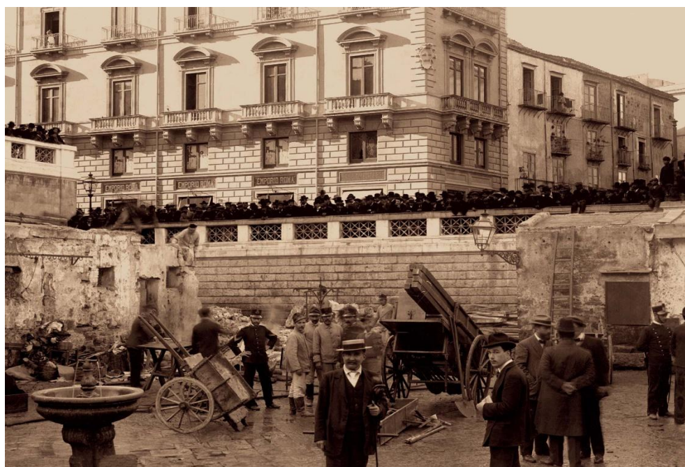
Figura 2 – La Vucciria (il cui significato è confusione), storico mercato di Palermo.