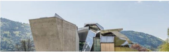
Steinhaus a Steindorf, 1982-2012