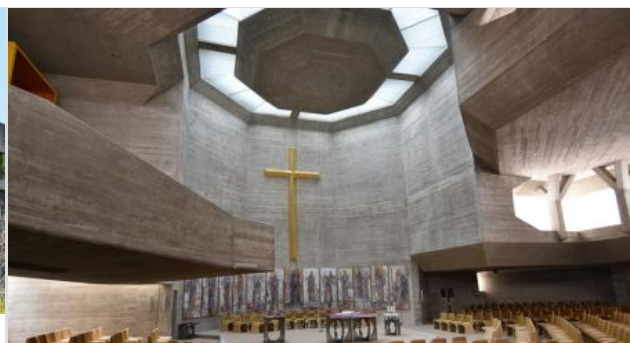
Chiesa di Oberwart, 1969