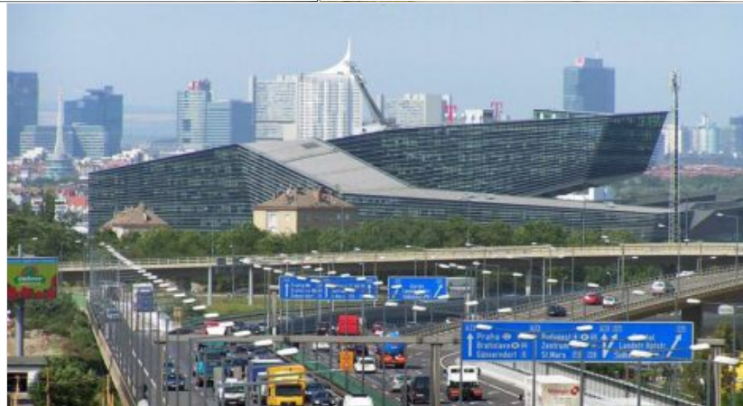
T-Center a Vienna, 2004