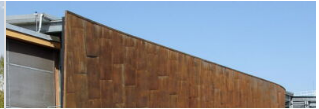
Fundermax a StVeit-Glan, 1987