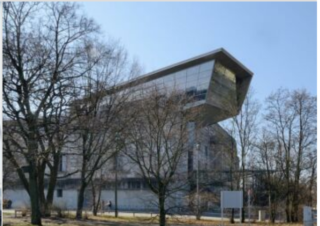
Dokumentationszentrum Reichsparteitagsgelände a Norimberga, 2007