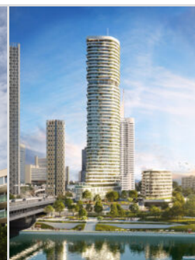
Danube Flats (A0...