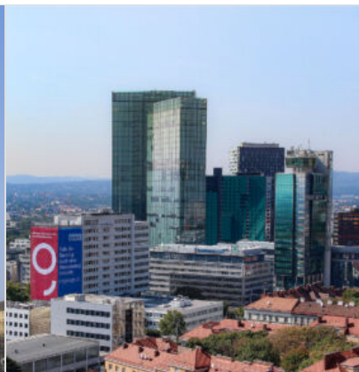
Twin Towers, Massimiliano F...