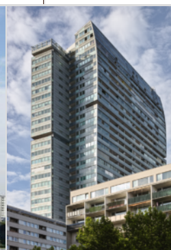
Donau City, torr...