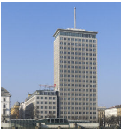
Ringturm, Erich Boltenstern ...