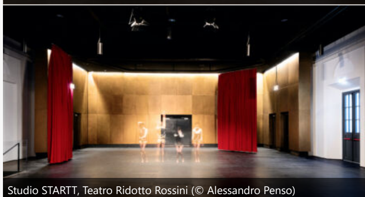
Studio STARTT, Teatro Ridotto Rossini