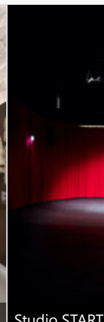
Studio STARTT Rossini