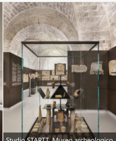
Studio STARTT, Museo archeologico Oliveriano