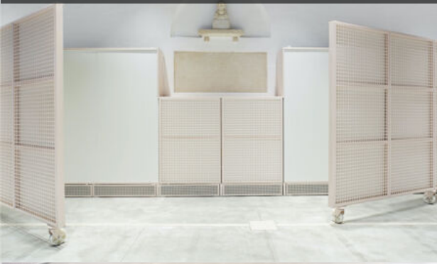
Studio WAR, Centro Arti Pescheria (© Alessandro Nanni)