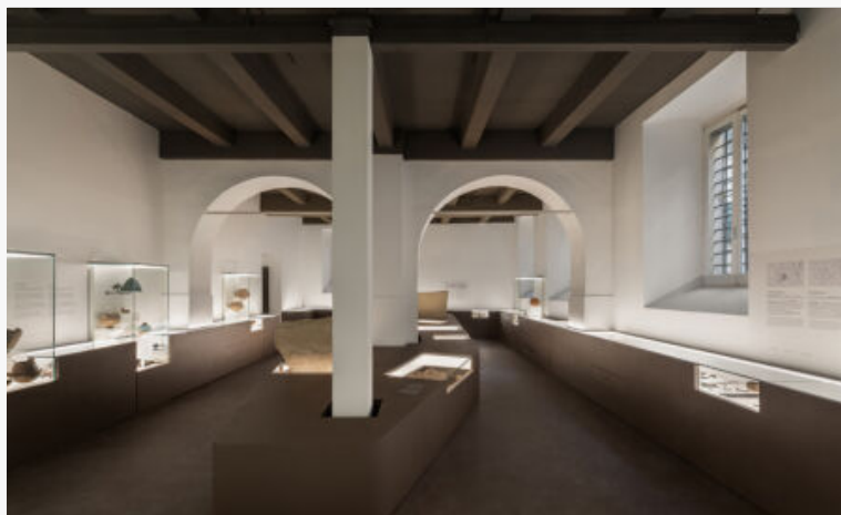
Studio STARTT, Museo archeologico Oliveriano (© Delfino Sisto Legnani)

Immagine di copertina: Museo archeologico Oliveriano (© Delfino Sisto Legnani)