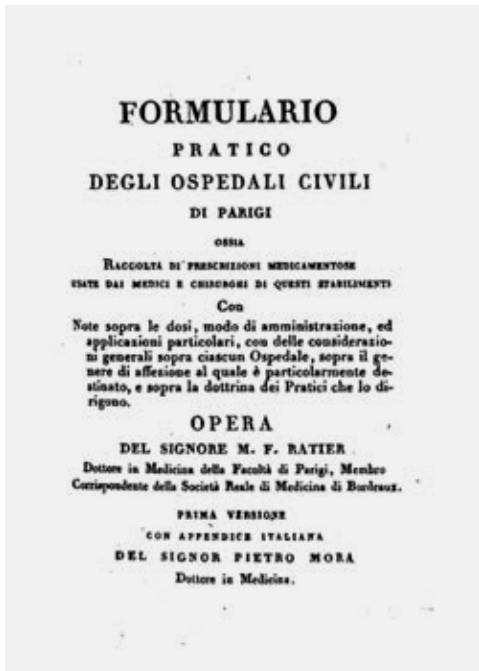
Fig. 6. RAITIER M.F., Formulario pratico degli Ospedali Civili di Parigi, 1824.

Sempre a base di oppio il Laudano liquido di Sydenham , chiamato dal Campana anche «Alcool con oppio e vino composto». Da questa formula con modificazioni è arrivato fino ai giorni nostri 22 . China nelle prescrizioni appare come « pulvis , vino, estratto, decozione». Potrebbe avere un uso nelle febbri intermittenti o nelle febbri da sifilide 23 . Il Vino amaro era costituito da china, radice di genziana, assenzio, camedrio, cannella, corteccia di arancio, salvia, vino 24 .