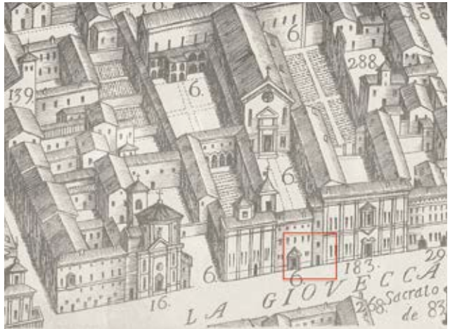
Fig 1. Ospedale S. Anna. Ingresso Ospedale e Spezieria. Particolare di una pianta prospettica di Ferrara disegnata da Andrea Bolzoni nel 1747.

Una disamina dettagliata dei documenti d'Archivio, Carteggio Amministrativo XIX secolo, ha fornito elementi per uno studio approfondito e parallelo dei luoghi e degli eventi 2,3 . In questo lavoro ci occuperemo invece in maniera specifica dell'aspetto prettamente legato al medicinale.