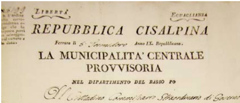
Fig. 2. Carteggio tra le Autorità locali.

Il ritrovamento fortuito di due elenchi di note spese del 1801, 9° Anno Repubblicano 4 , ha aperto la possibilità di individuare i preparati galenici allestiti nella Spezieria dell'Arcispedale S. Anna per i militari francesi ricoverati e per focalizzare le patologie correlate.