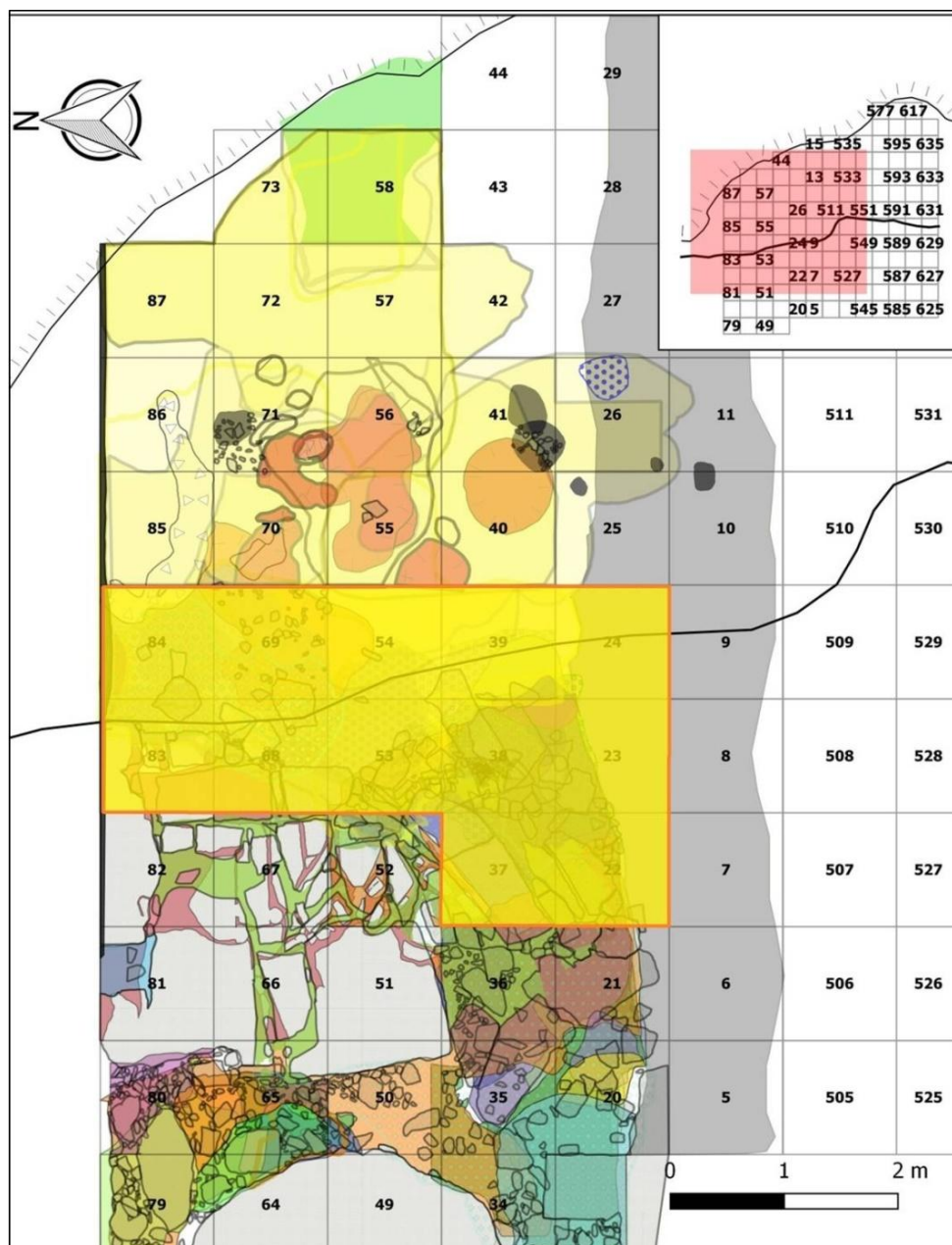
Fig. 1 – Risultato della digitalizzazione delle planimetrie cartacee in QGIS. Il rettangolo giallo identifica l’area di transizione fra interno ed esterno del riparo che rappresenta il focus di questo lavoro.

Result of the digitalisation in QGIS of the hand-drawn maps. The yellow polygon marks the transitional area between the inner and outer sector of the site that is the main focus of the work.